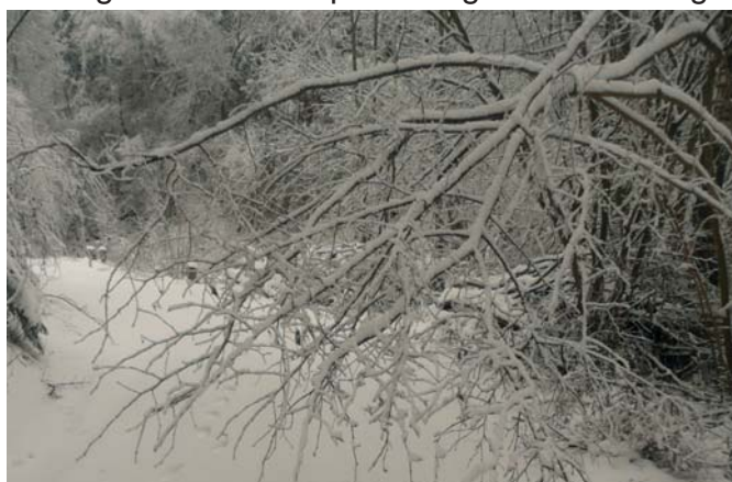
die Hauptnahrung im Winter für das Wild.

Information und Weiterbildung ist auch für uns Jäger ein Muss. So auch am 11. November vergangenen Jahres. Unser Bezirksjägermeister hat zu diesem Informationsabend nach Strallegg eingeladen. Leider war diese Veranstaltung für berufstätige Jäger oder uns Rinderbauern zu früh angesetzt. Das dürfte vermutlich auch der Grund gewesen sein, dass trotz des sehr interessanten Themas relativ wenige Grünröcke anwesend waren. Auch ich hatte Mühe, nach der Stallarbeit noch rechtzeitig vor Ort zu sein. Mich interessieren solche Veranstaltungen immer, und wenn es möglich ist, bin ich dabei. Gespannt war ich auf das Thema: Rehwildjagd, aus der Praxis für die Praxis. Zwei Revierversantwortliche referierten über ihre jagdliche Praxis. Das eine Revier liegt ganz im Norden unseres Bezirkes, das Zweite im Süden. Diese Jagden sind so unterschiedlich, dass sie unterschiedlicher nicht sein könnten. Mir persönlich hat die jagdliche Praxis im Revier im Norden des Bezirkes besser zugesagt. Nicht nur deshalb, weil es keine Fütterungen gibt, sondern auch, weil das Wild noch Wild sein kann. Zum einen ist der Wildstand dem natürlichen Äsungsangebot angepasst, da es wenig Strauch- und Dornenbewuchs, wie Brombeere und dergleichen gibt. Die Knospenäsung ist in der Regel